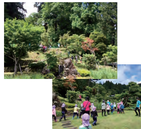
豊かな自然の中に人々が集う「令和共生の里プロジェクト」

また成人・高齢者の難聴に対応した補聴器外来も行っている。 「難聴にはいろいろあります。治療で改善する難聴、補聴器があまり有効でない難聴など人それぞれなので、補聴器を考えたらず、まず耳鼻科を受診、相談することが大切です」 阿部耳鼻咽喉科は秋田県の開業医では