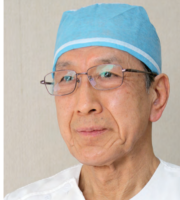
●阿部耳鼻咽喉科医院 院長